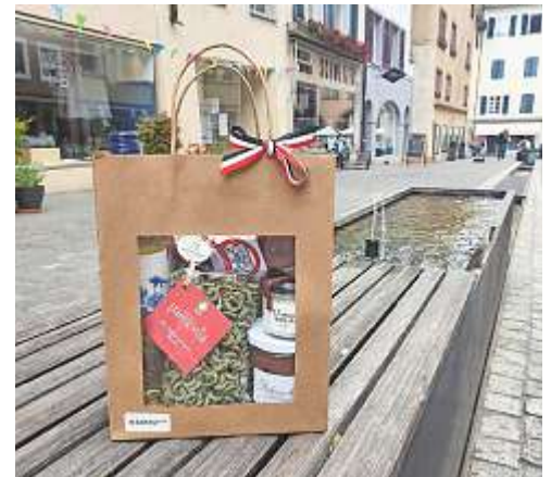
Geschenk-Sets mit lokalen Leckereien werden von Aarau Info auf Wunsch zusammengestellt – einfacher geht es nicht. AARAU INFO