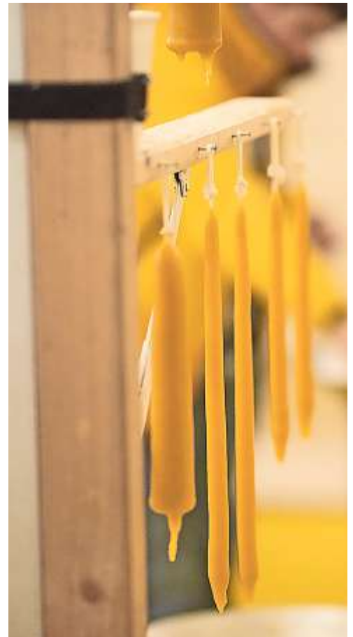
Das Aarauer Kerzenziehen findet vom 26. November bis 12. Dezember in der Markthalle statt.

Der Nettoerlös geht an insieme Aarau-Lenzburg, einen gemeinnützigen Verein, und kommt Menschen mit einer kognitiven Beeinträchtigung aus unserer Region zugute. Das Team vom Aarauer Kerzenziehen und insieme Aarau-Lenzburg freuen sich auf zahlreiche Besucherinnen und Besucher.