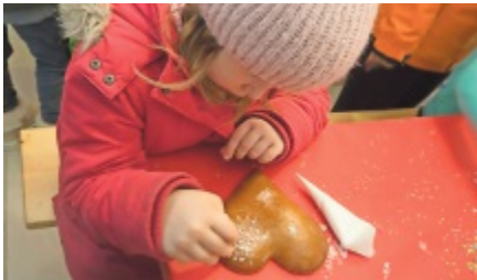
Das Verzieren der Lebkuchenherzen ist ein Highlight bei den kleinen City-Märt Gästen.

Am Mittwoch, 24. November 2021, wird sich die City-Märt-Mall wieder mit feinstem Lebkuchenduft und vielen Kindern füllen. Jaisli-Beck lädt um 14 Uhr zum Verzieren von Lebkuchenherzen ein. Dank einem griffigen Schutzkonzept und Maskenpflicht können sich grosse wie kleine City-Märt Gäste jederzeit sicher fühlen. Es het, solangs het – im City-Märt Aarau.