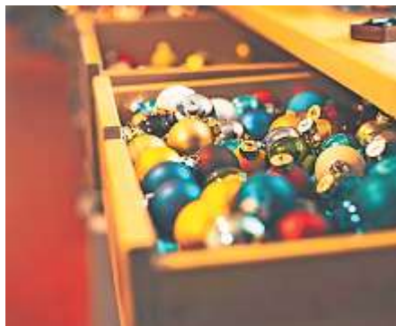
Mit viel Liebe zum Detail wird der Weihnachtsschmuck von INGE-GLAS® MANUFAKTUR hergestellt.

Öffnungszeiten Advents-/Weihnachtsmarkt Montag bis Freitag, 09.00–18.30 Uhr Samstag, 08.00–17.00 Uhr Noch bis am 24. Dezember 2021