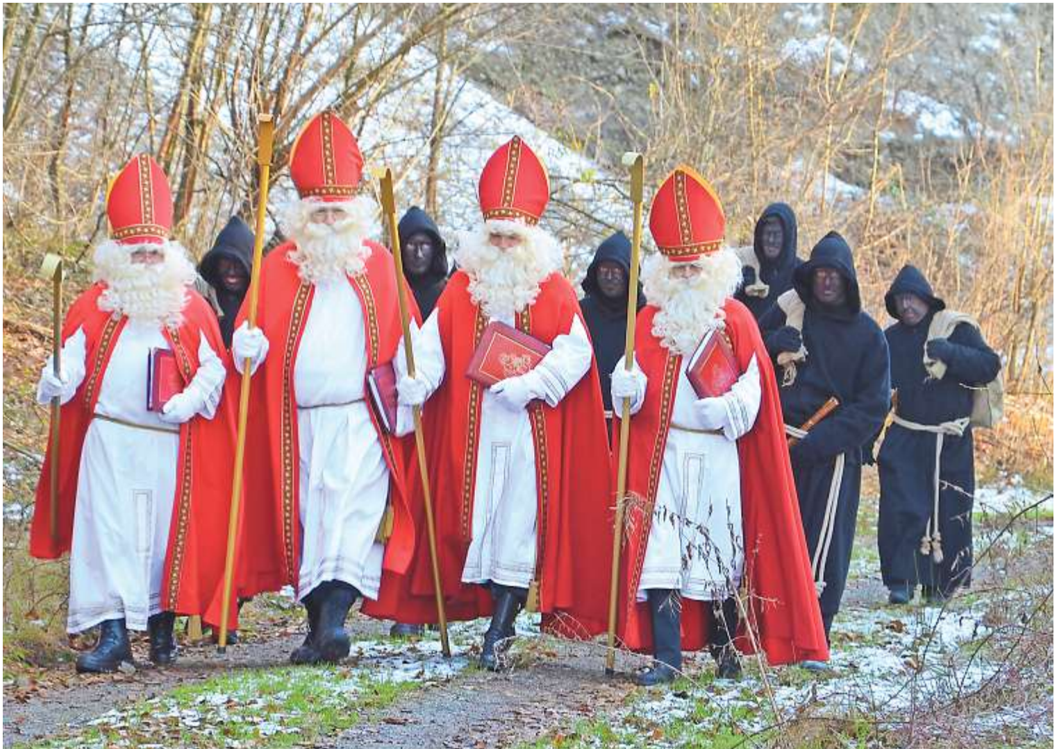
Die Samichläuse und Schmutzlis treten ihre Reise nach Aarau, zum Umzug durch die stimmungsvollen Gassen, an. CHLAUSZUNFT AARAU-WEST

Rathauses, und die Samichläuse und ihre Gehilfen treten in die Gasse, um den Umzug durch das Adelbändli, die Milchgasse, die Pelzgasse und den Graben anzutreten. Die Chlauszunft Aarau-West stellen die Samichläuse und Schmutzlis, welche ein imposantes Erscheinungsbild abgeben. Aarau Standortförderung lädt herzlich zum neuen Aarauer Anlass ein, welcher unter dem Patronat des Gewerbeverbands Aarau steht und somit überhaupt ermöglicht wird. Den Veranstaltern ist es wichtig, dass der Chlausauszug eine würdige und stimmungsvolle Präsenz erhält. Der Abend soll für Gross und Klein zu einem besonderen Erlebnis werden und vor allem Kinderherzen höherschlagen lassen.