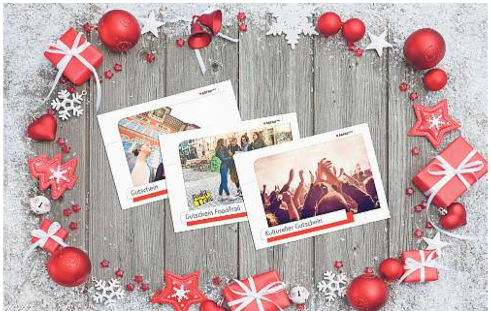
BILDMONTAGE MIT GUTSCHEINEN

Unternehmungslustig: Unvergessliche Freizeiterlebnisse, leckere Genussmomente oder wohltuende Beautybehandlungen – mit dem 2für1 Booklet erleben Sie dies immer zum