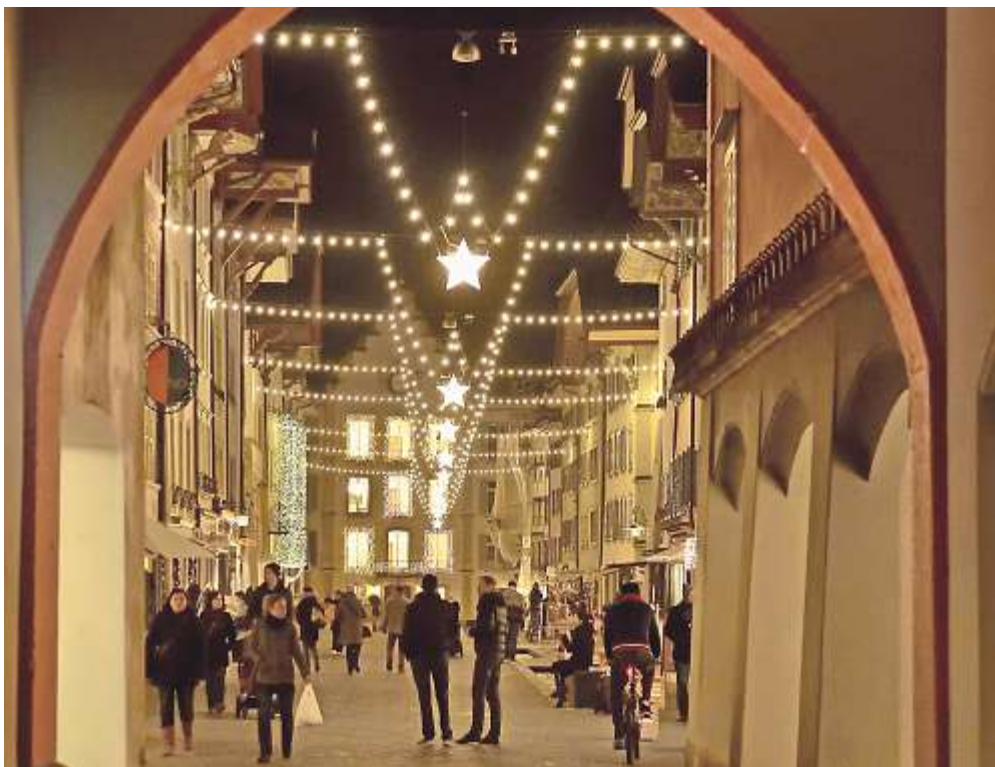
Das diesjährige Aarau Night Shopping ist wiederum der Auftakt in die Adventszeit und findet am Freitag, 26. November statt.

Die Läden sind am diesjährigen Night Shopping bis 22 Uhr geöffnet, die Weihnachtsbeleuchtung wird eingeschaltet, die Restaurants bieten drinnen und draussen Kulinarisches an und die Fachgeschäfte sorgen mit dekorierten Weihnachtsbäumen vor den Läden und festlich gestalteten Schaufenstern für weihnachtliche Stimmung. In der City-Märt Mall gibt's ab 18.00 Uhr musikalische Unterhaltung mit den Crazy Hoppers und dem Rockenten Chor. Zum Anstossen auf die Festtage können Sie ein Gratis-Cüpli im Coop-City Restaurant geniessen. Fehlen werden Verkaufsstände im Freien für Getränke und Esswaren, Musikgruppen und Chöre sowie weitere Attraktionen. Trotzdem, einer Einkaufstour mit der Freundin, der Mutter oder dem Bürogshpänli steht nichts im Weg.