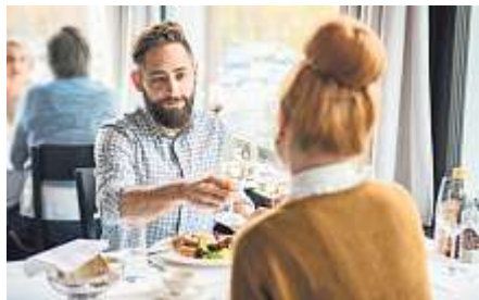
Ankommen und geniessen – die Weekend-Angebote machen es möglich.

Aarau einkaufen und Aarau kulturell: Diese beiden Pauschalpackages bieten dem Besucher viel Komfort. Ein Aufenthalt im Doppelzimmer eines Drei-Sterne Hotels kostet für eine Nacht nur 159 Franken, 199 Franken im Vier-Sterne Hotel. Die Besucherinnen und Besucher erhalten an den Tagen ihres Aufenthaltes eine gratis Fahrkarte für die Nutzung des öffentlichen Verkehrs im gesamten A-Welle-Gebiet, einen Einkaufs- oder Museumsgutschein und einen Gastrogutschein für ein Aarauer Restaurant. Man darf sich von der Vielseitigkeit Aaraus überraschen lassen. Wer schon lange gerne seine Bekannten oder Verwandten nach Aarau einladen möchte, sollte diese Gelegenheit nicht verpassen. Informationen gibt es auf www.aarauinfo.ch/weekend .