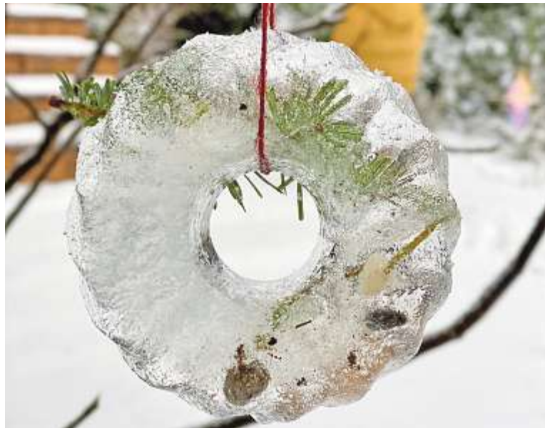
Die schöne Eisdeko verzaubert jeden Garten.

Die fertigen Eisanhänger können im Garten direkt in die Zweige von Bäumen oder Sträuchern oder an Äste in einer Vase gehängt werden. Der Kreativität sind keine Grenzen gesetzt.