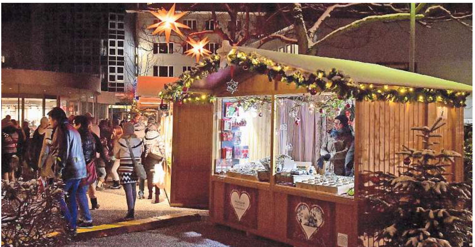
Der 4. Aarauer Weihnachtsmarkt am Graben findet vom 26. November bis 12. Dezember 2021 statt.

Mehr Informationen zum Aarauer Weihnachtsmarkt unter www.aarauinfo.ch/weihnachten