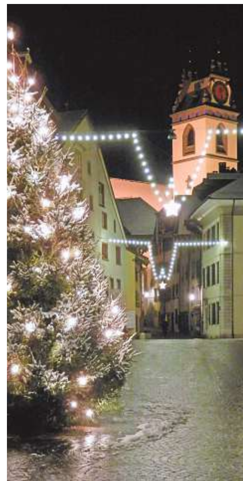
Die beleuchtete Altstadt bietet den passenden Rahmen für stimmungsvolle Stadtführungen.